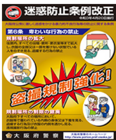
チラシ表面(PDFファイル:246KB)