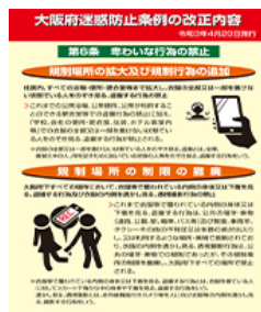
チラシ裏面(PDFファイル:305.5KB)