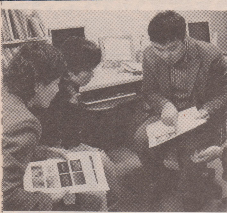
画像を検証する現地女性団体の関係者

情からは動揺が読み取れる。女性オナーは唇をへの字に曲げ、時に目を細め、何度も画像に目を凝らし、ついには苦悶の表情を浮かべてこう言った。 「ここに映っている汗蒸幕は、うちではありません」 もとよりわれわれはそれを認めさせるために訪ねたのではない。事実として盗撮犯罪が存在することを知ってほしかったのである。すると、それを察したかのように女性オナーがこう言った。 「今まで思ってもいなかったことが起こってびっくりしています。お客に対して、しっかりした対応を取らなければ問題になるところだったので、自分も今自覚しました。今までは習慣どおりにやってきたけど、これからは気をつけなければいけないと思います」