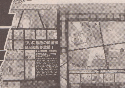
「韓流盗撮DVD」のパッケージ

そのうえさらに、もし日本国内で販売されている先の「韓国風呂盗撮ビデオ」が日本人の手によって盗撮されたものだとしたら大変な事態になる。現在、日韓両国は決して良好な関係にあるとは言えない。私は険悪化する可能性のある国際情勢を視野に入れ、